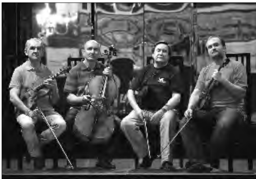
Kwartet Prima Vista