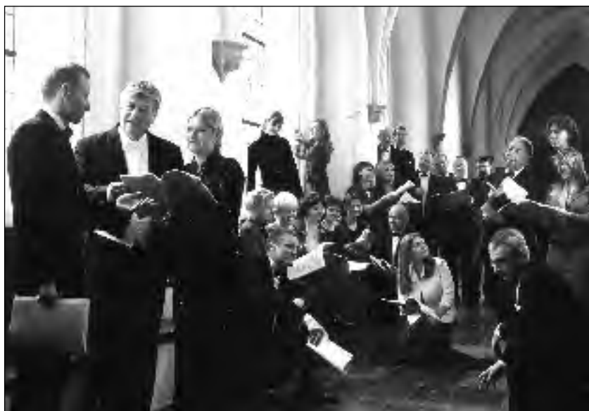
Polski Chór Kameralny – Schola Cantorum Gedanensis