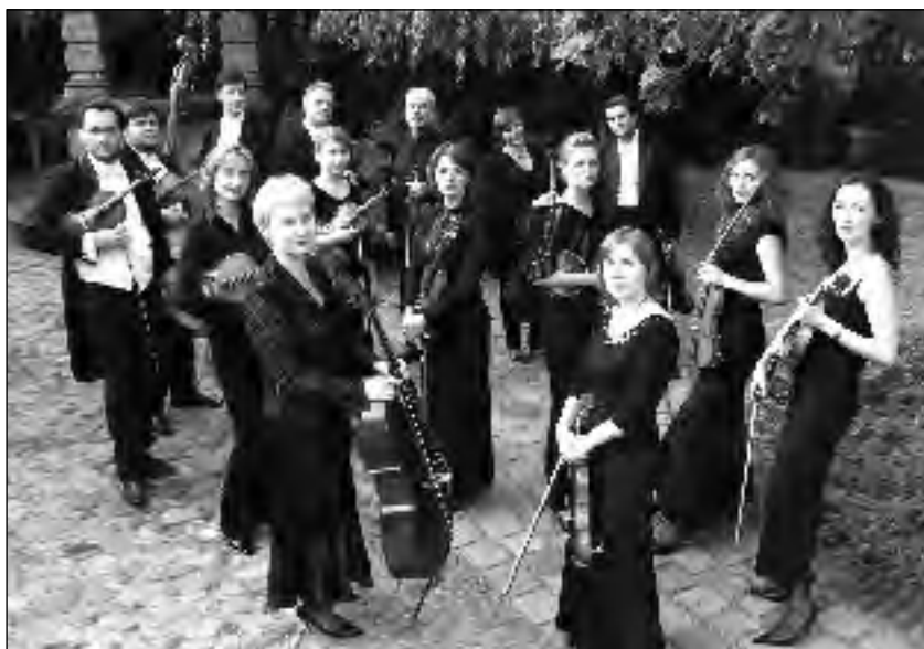
Orkiestra Kameralna „Wratislavia”

Orkiestra zainauguowała swoją działalność koncertem w ramach festiwalu Warszawskie Spotkania Muzyczne „Muzyka Dawna – Muzyka Nowa” w 1996 roku. Od 1997 roku jej stałą wrocławską estradą są do- roczne Festiwale Muzyki Kameralnej „Wieczory w Arsenale”, których